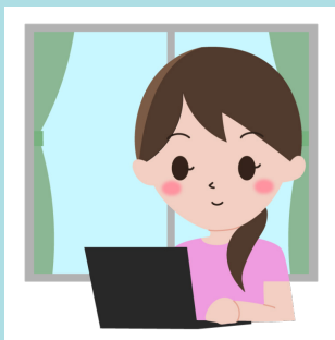
ICTを活用した遠隔面談の実施